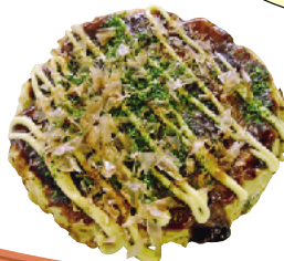
岩津ねぎのお好み焼き