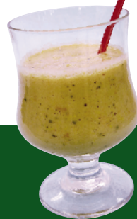
ベジ・スムージー