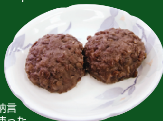
美方大納言小豆を使ったおはぎ