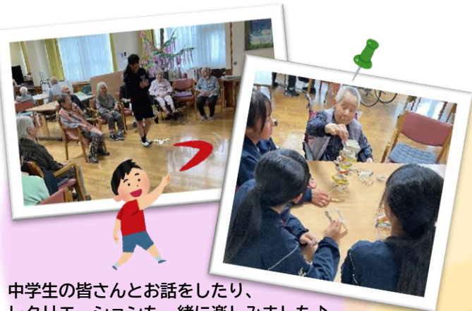
中学生の皆さんとお話をしたり、 レクリエーションも一緒に楽しみました♪