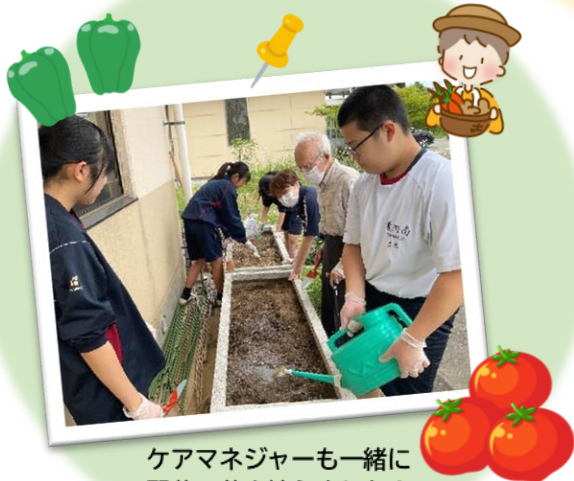
ケアマネジャーと一緒に 野菜の苗を植えました！