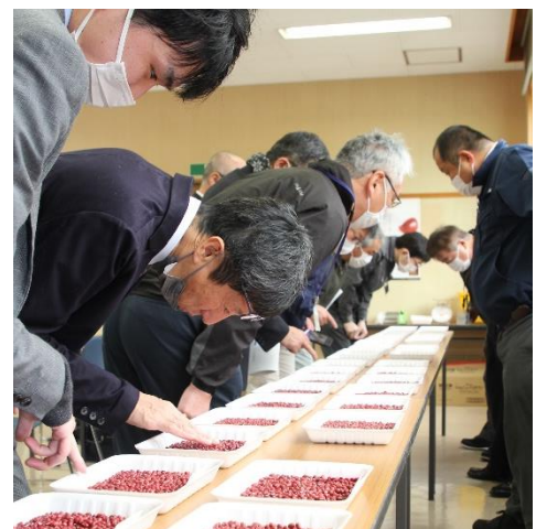
昨年の品評会の様子

JA たじまは但馬地域を管内とする農業協同組合です。「たじまに生きる・たじまを活かす」をモットーに、農業発展と地域活性化に貢献するため多岐にわたる事業を展開しています。