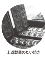
上道製菓のたい焼き