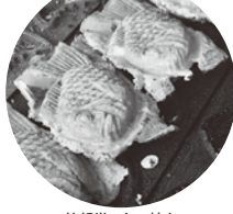
笑起堂のたい焼き